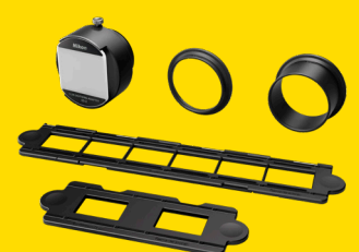
FILMDIGITALISIERUNGS- ADAPTER ES-2